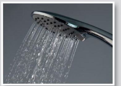
Lluvia fina +hidromasaje Thin rain + hydro-massage jet