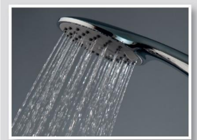
Lluvia fina / Thin rain jet