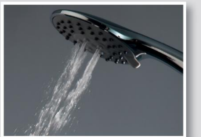
Hidromasaje Hydro-massage jet