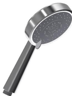
DXT5 45 - Mango de ducha T5 jets / T5 jets handshower