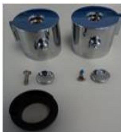
68988 18 - Kit volantes columnas termostáticas Tau / Tau thermostatic column handle set

Recambios de la CT67110 18 versión actual, ver ficha CT67110 18