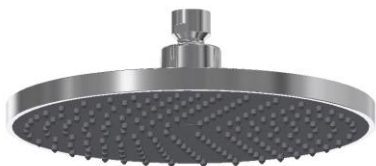
R65112 18 - Rociador redondo 22 cm / Round shower head Ø 22 cm