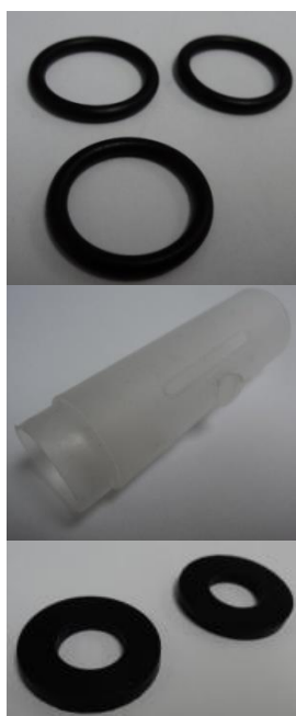
9908 0030 - Set juntas columna redonda / Round column gasket set