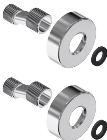
100127 45 - Conjunto florón y excéntricas Redondo D65 / Round D65 scutcheon and eccentric set