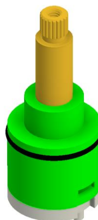
100069 - Inversor cerámico columna termostática / Thermostatic column ceramic diverter