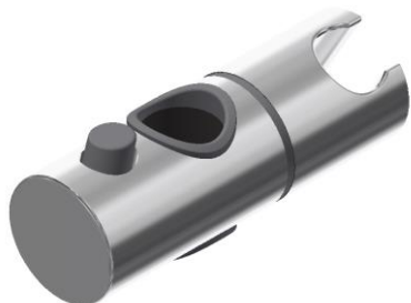
9908 0031 - Soporte deslizante columna redonda / Round column shower holder