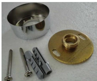
9908 0172 - Soporte superior set redondo / Upper holder of round set