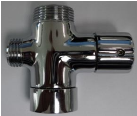
9908 0032 - Inversor columna redonda / Round column diverter