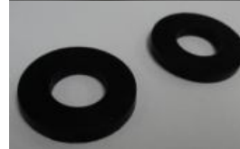
9908 0030 - Set juntas columna redonda / Round column gasket set