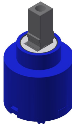
100049 - Cartucho cerámico D40 convencional / Conventional D40 ceramic cartridge