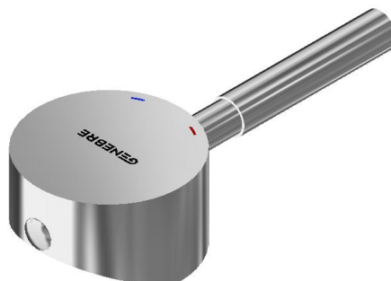
100001 18 45 - Maneta Tau / Tau lever

Recambios de la CM65110 18 versión actual, ver ficha CM65110 18