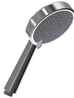
DXT5 45 - Mango de ducha T5 jets / T5 jets handshower