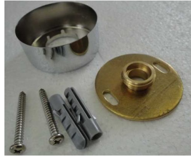
9908 0172 - Soporte superior set redondo / Upper holder of round set