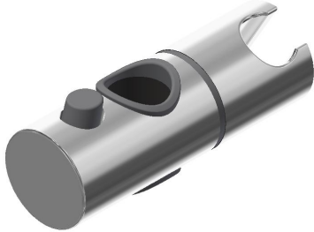
9908 0031 - Soporte deslizante columna redonda / Round column shower holder