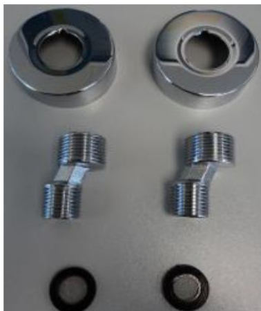
100127 45 - Conjunto florón y excéntricas Redondo D65 / Round D65 scutcheon and eccentric set