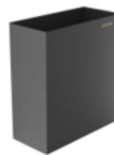
GW06 14 04 03 Inox 304 Negro Mate