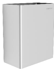
GW06 14 04 01 Inox 304 Satinado